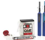
Kits de nettoyage